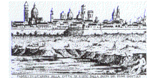
associazione dei geometri della Provincia di Reggio Emilia